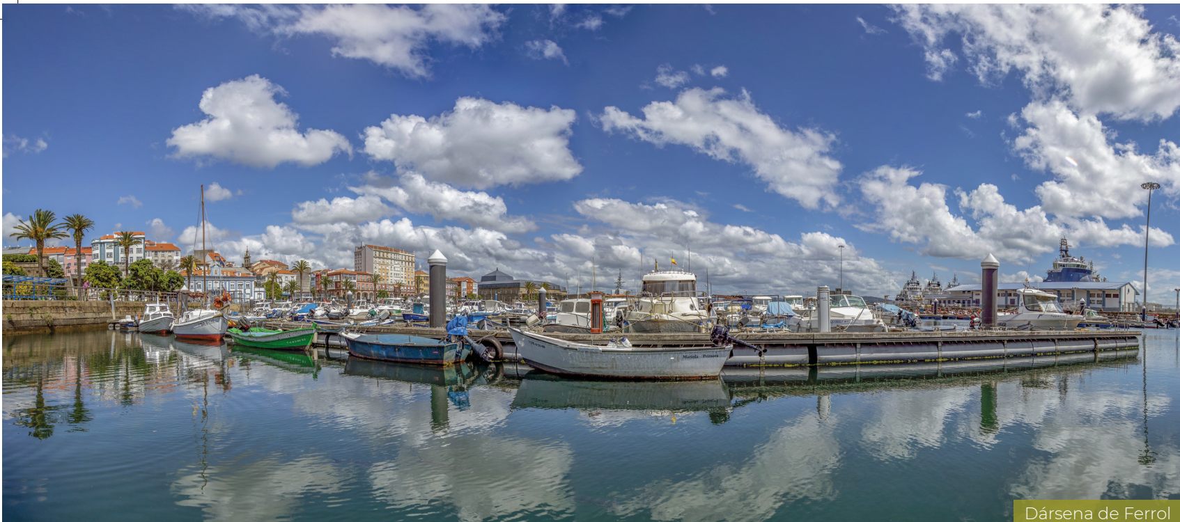
Dársena de Ferrol

■ El muelle de Curuxeiras , a poco más de 113 km de Santiago, es el comienzo del Camino Inglés en la rama que parte de Ferrol. Ahí está Ferrol Vello, el barrio que dio origen a la ciudad, asentadas sus casas sobre un castro prehistórico. Un barrio que tenía su propia iglesia, la cual ya en tiempos del barroco acabó siendo demolida visto su penoso estado, mientras se construía la actual concatedral de San Julián. De ahí, pues, parte el peregrino, para a los pocos metros comenzar a ascender y encontrarse la primera grata sorpresa: la iglesia de San Francisco.